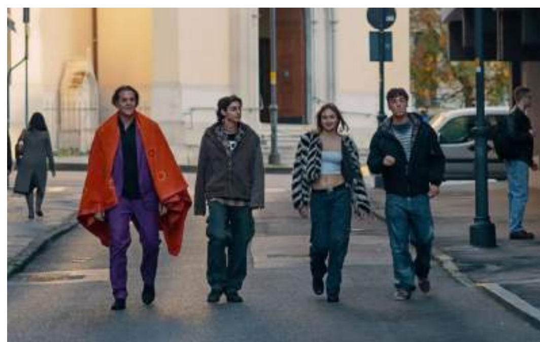
DRAMMATICO, 102' Un Anno di Scuola di Laura Samani