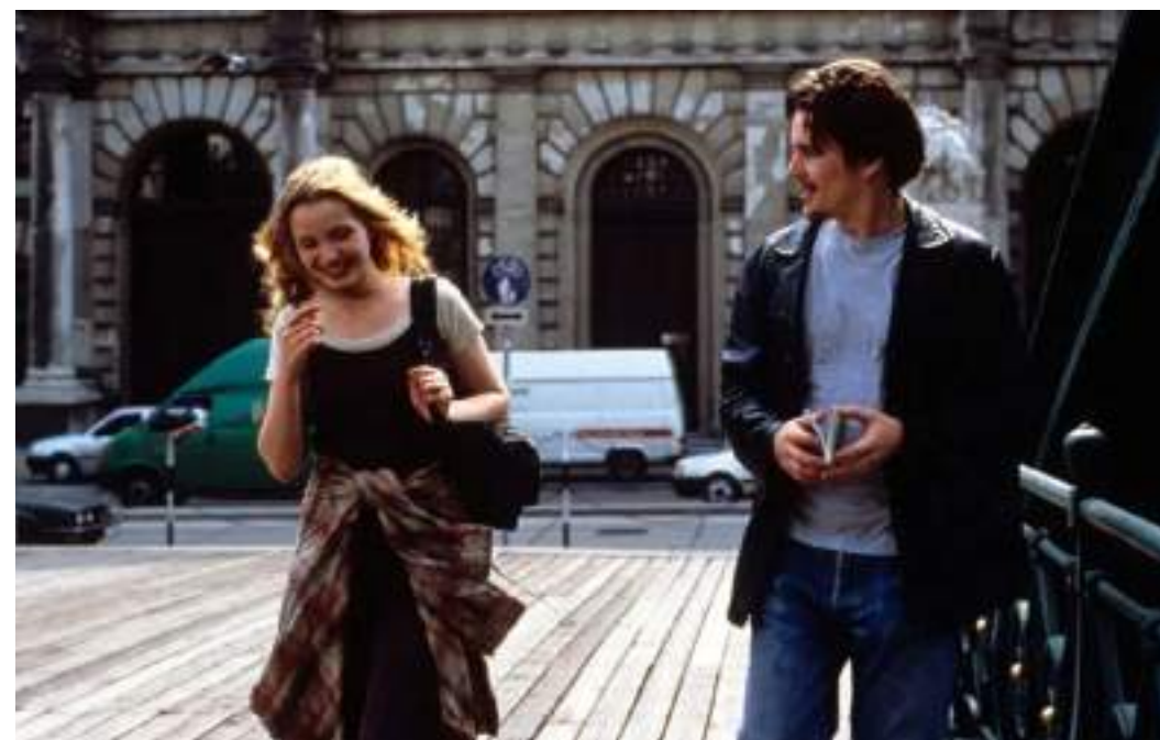
DRAMMATICO, 105' Prima dell'alba di Richard Linklater