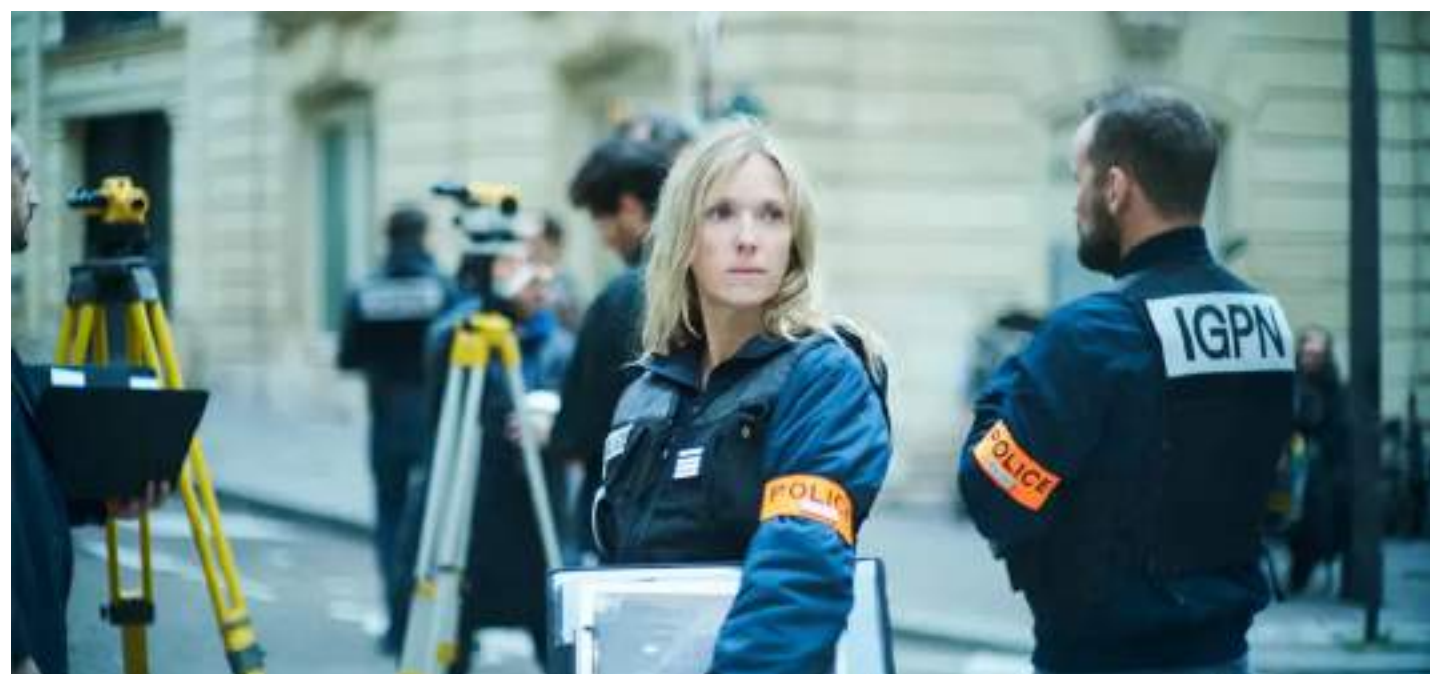
THRILLER, 116' Il caso 137 di Dominik Moll