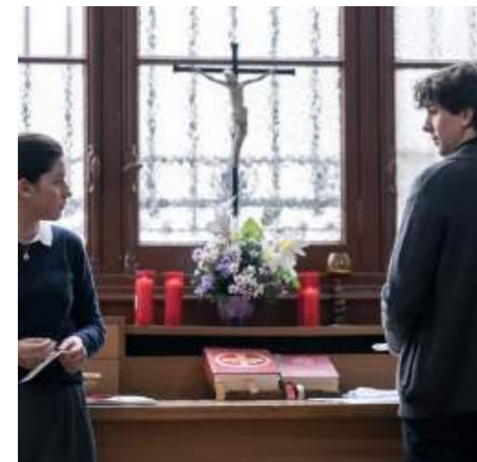
DRAMMATICO, 115' Los Domingos di Alauda Ruiz de Azúa