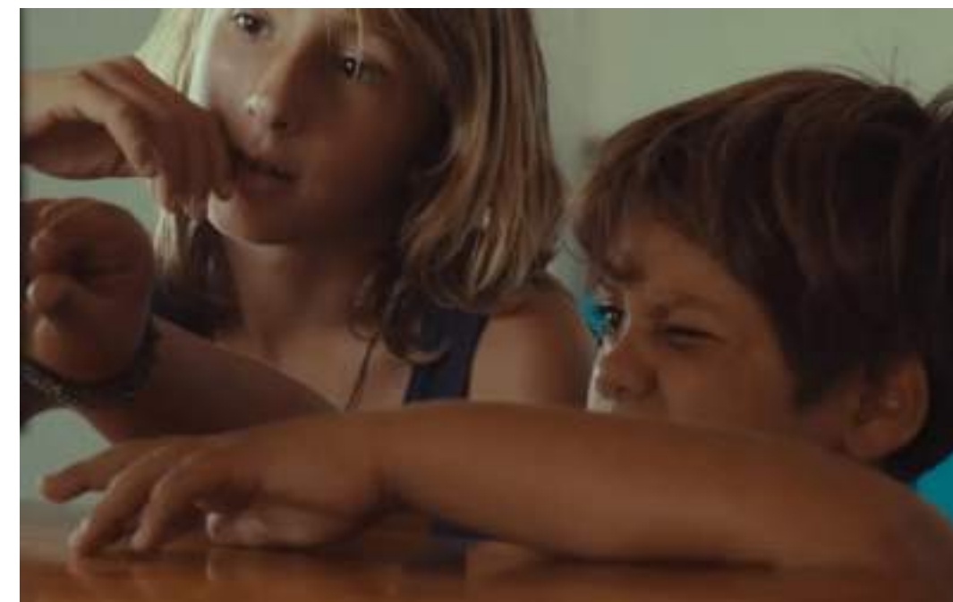
DRAMMATICO, 86' Sciatunostro di Leandro Picarella