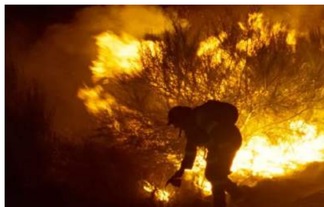
DRAMMATICO, 85' O que arde-Verrà il fuoco di Oliver Laxe