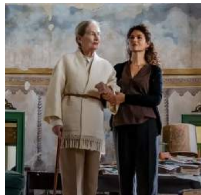
DRAMMATICO, 125' Vita mia di Edoardo Winspeare