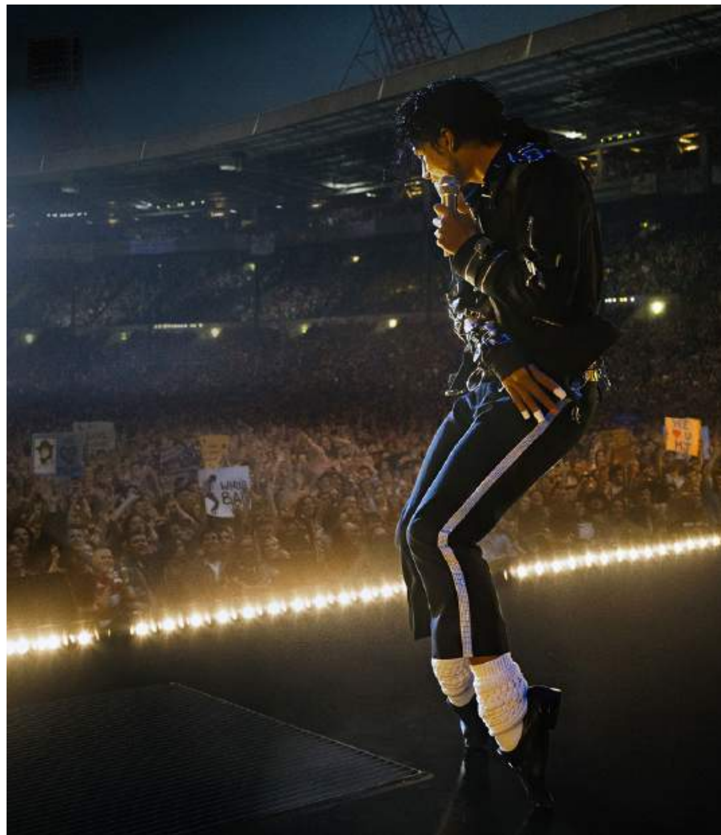
BIOGRAFICO, 127' Michael di Antoine Fuqua