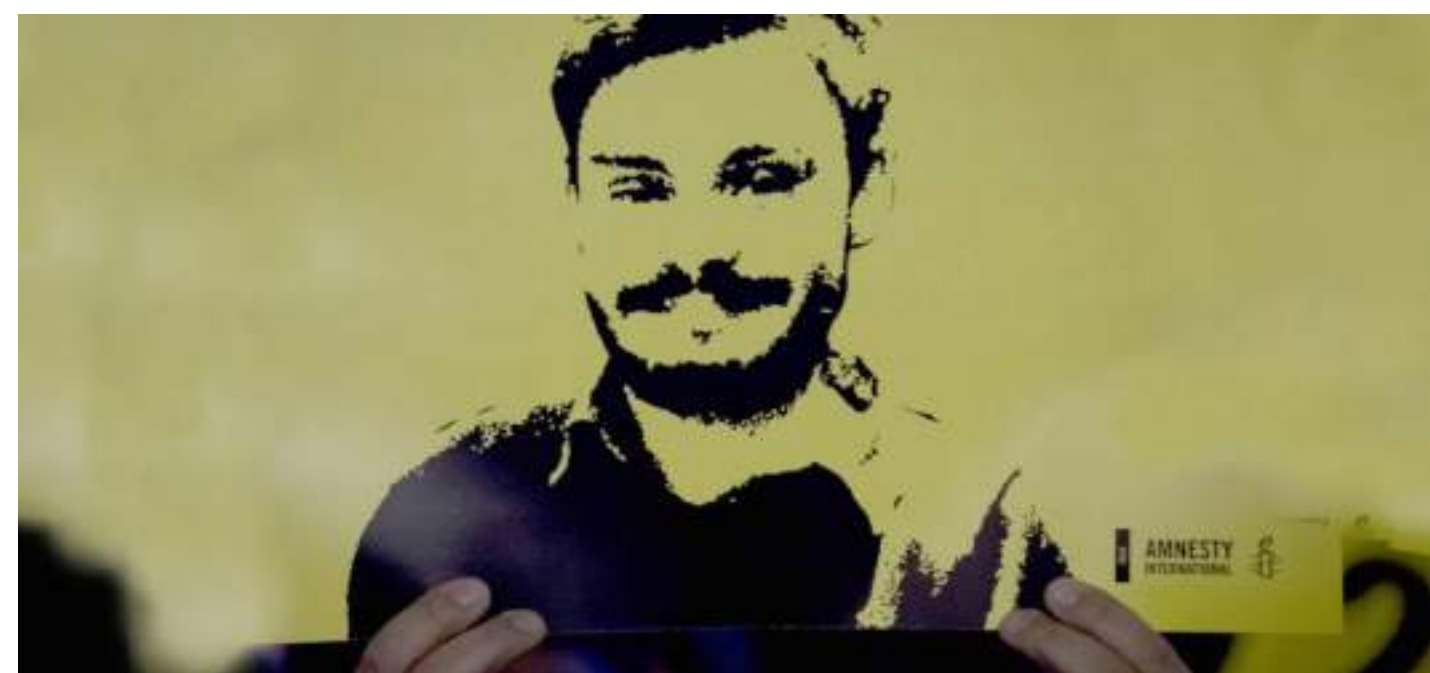
DOCUMENTARIO, 100' Giulio Regeni-Tutto il male del mondo di Simone Manetti