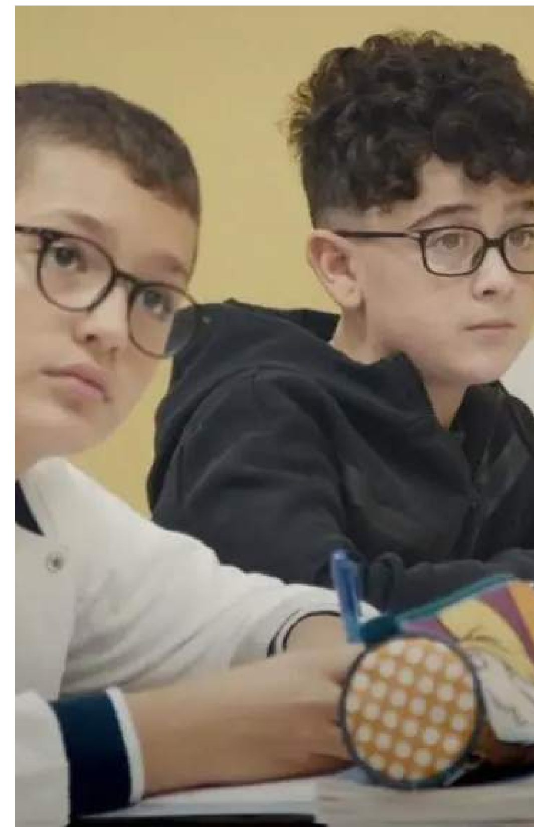
PRIMAVERA 2026 DOCUMENTARIO, 97' D'istruzione pubblica di Mirko Melchiorre, Federico Greco