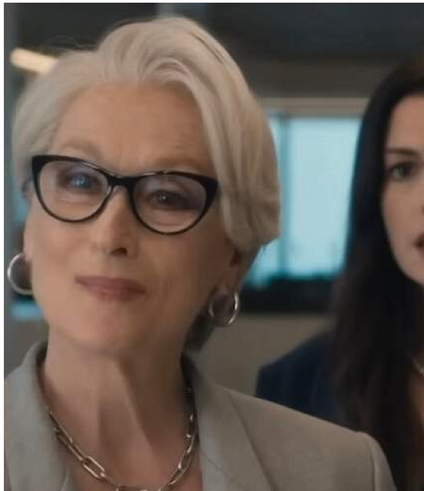
COMMEDIA, 117' Il Diavolo Veste Prada 2 di David Frankel