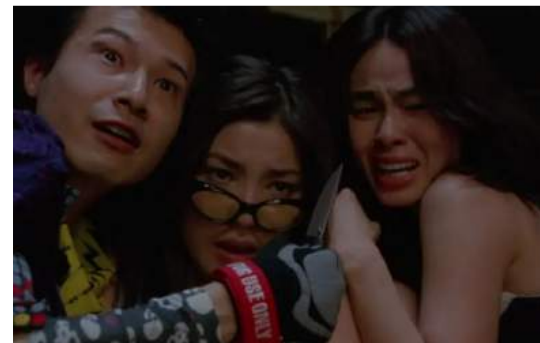
THRILLER, 99' 14+ Suicide Club di Sion Sono