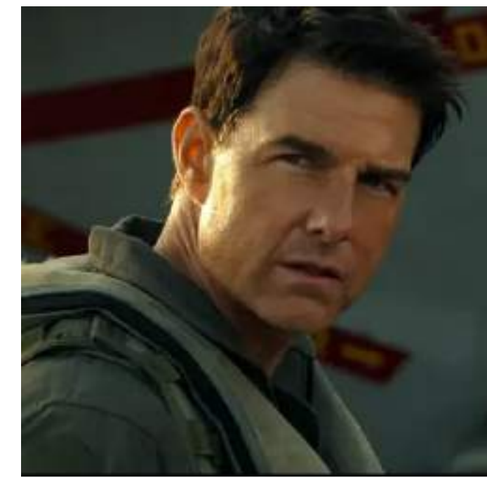
AZIONE, 131' Top Gun-Maverick di Joseph Kosinski