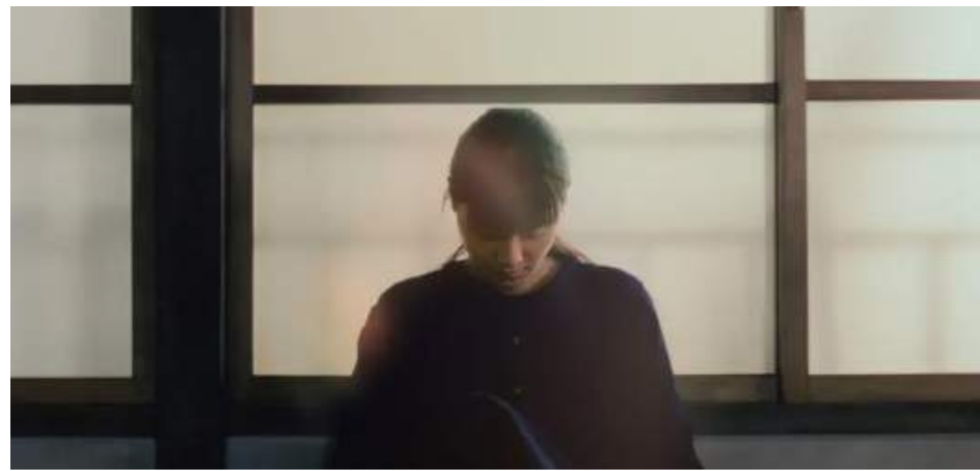
DRAMMATICO, 110' Maborosi-I bagliori dell'anima di Hirokazu Kore-Eda