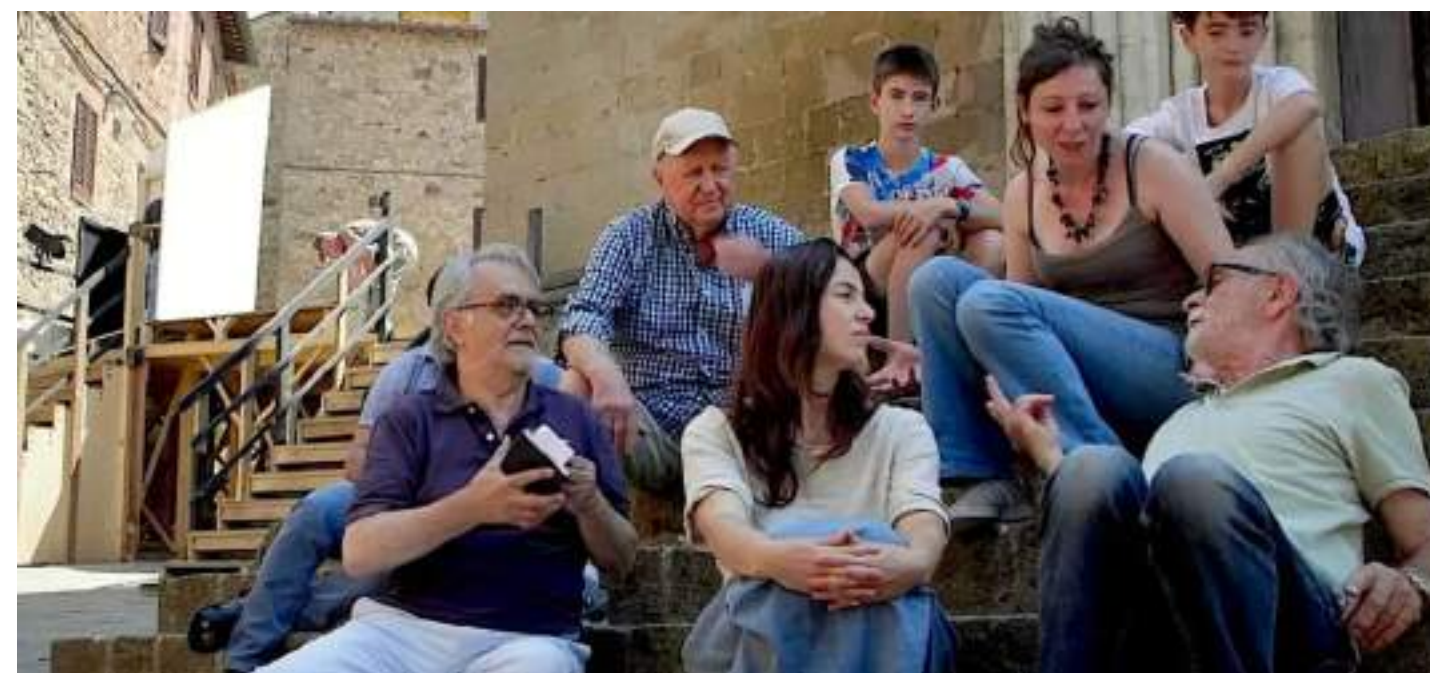
14.05-OSPITI IN SALA DOCUMENTARIO, 80' Storie di donne, uomini e comunità di Paola Traverso, Vincenzo Franceschini