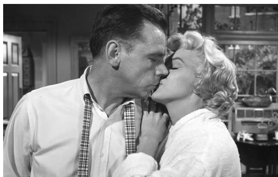
COMMEDIA, 105' Quando la moglie è in vacanza di Billy Wilder