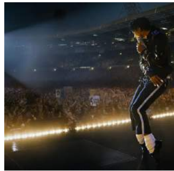
BIOGRAFICO, 127' Michael di Antoine Fuqua