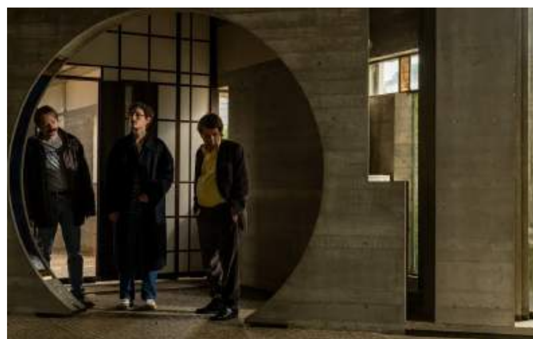
COMMEDIA, 100' Le città di pianura di Francesco Sossai