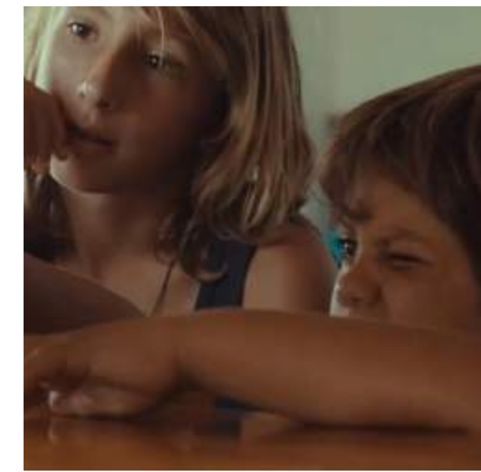
DRAMMATICO, 86' Sciatunostro di Leandro Picarella